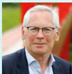
Jean-Paul Jeandon Maire de Cergy Président de la Communauté d'agglomération de Cergy-Pontoise

Entente et vivre ensemble, bonne humeur et jeux seront les éléments moteurs de ces quatre demi-journées de rencontres.